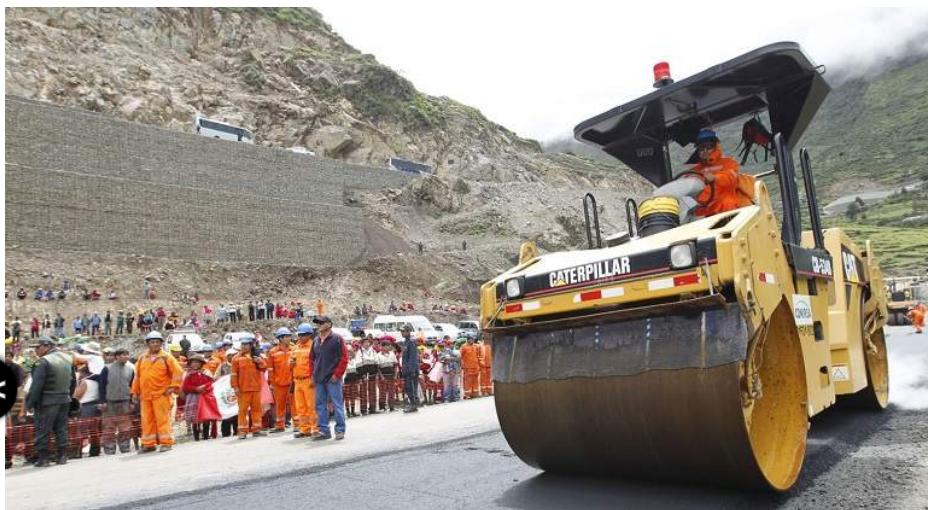
PCR proyecta crecimiento de 4%